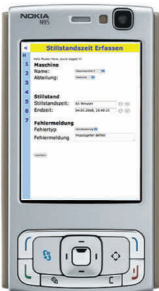
Bild 3: Für die mobile Zeiterfassung arbeitet das Automatisierungssystem app z.B. mit dem Nokia N95.

Beim Austausch eines defekten Gerätes oder bei einer Erweiterung erhält der Anwender ein definiertes Gerät, ohne sich Gedanken über Lizenzen oder laufende Kosten machen zu müssen. Zudem sind alle Anwendungen betriebssystemunabhängig – app kommuniziert mit jedem Operating System (OS) wie Windows, Linux, Nokia, iPhone, Palm und Apple. ■